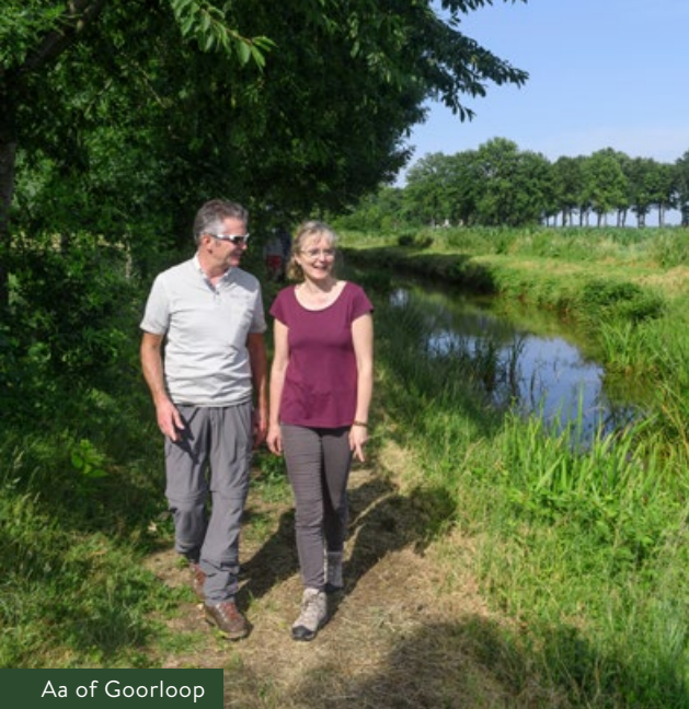
Aa of Goorloop