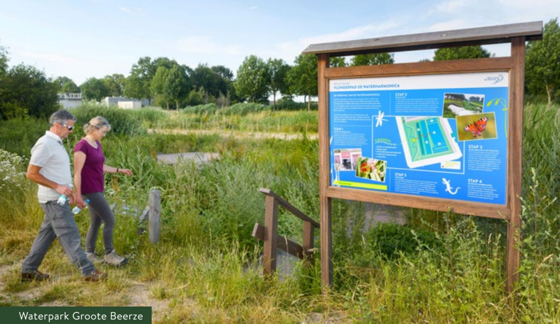
Waterpark Grote Beerze