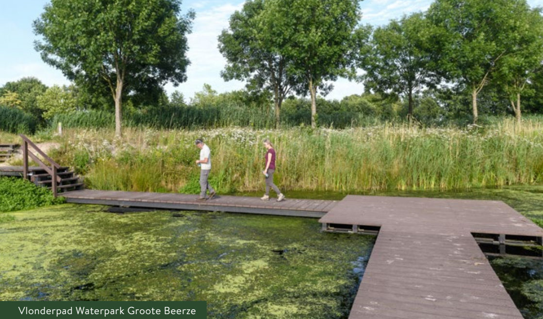
Vlonderpad Waterpark Groote Beerze